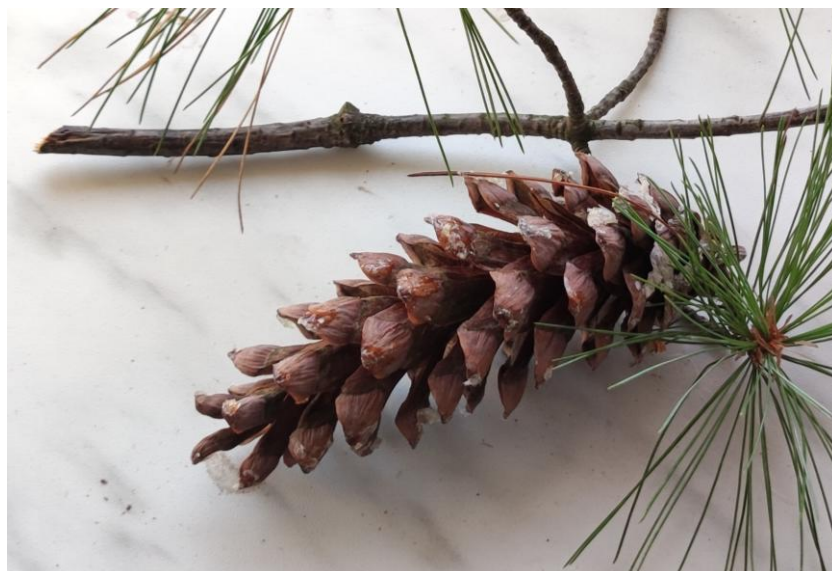
Fot 2d: Igły i szyszka żeńska