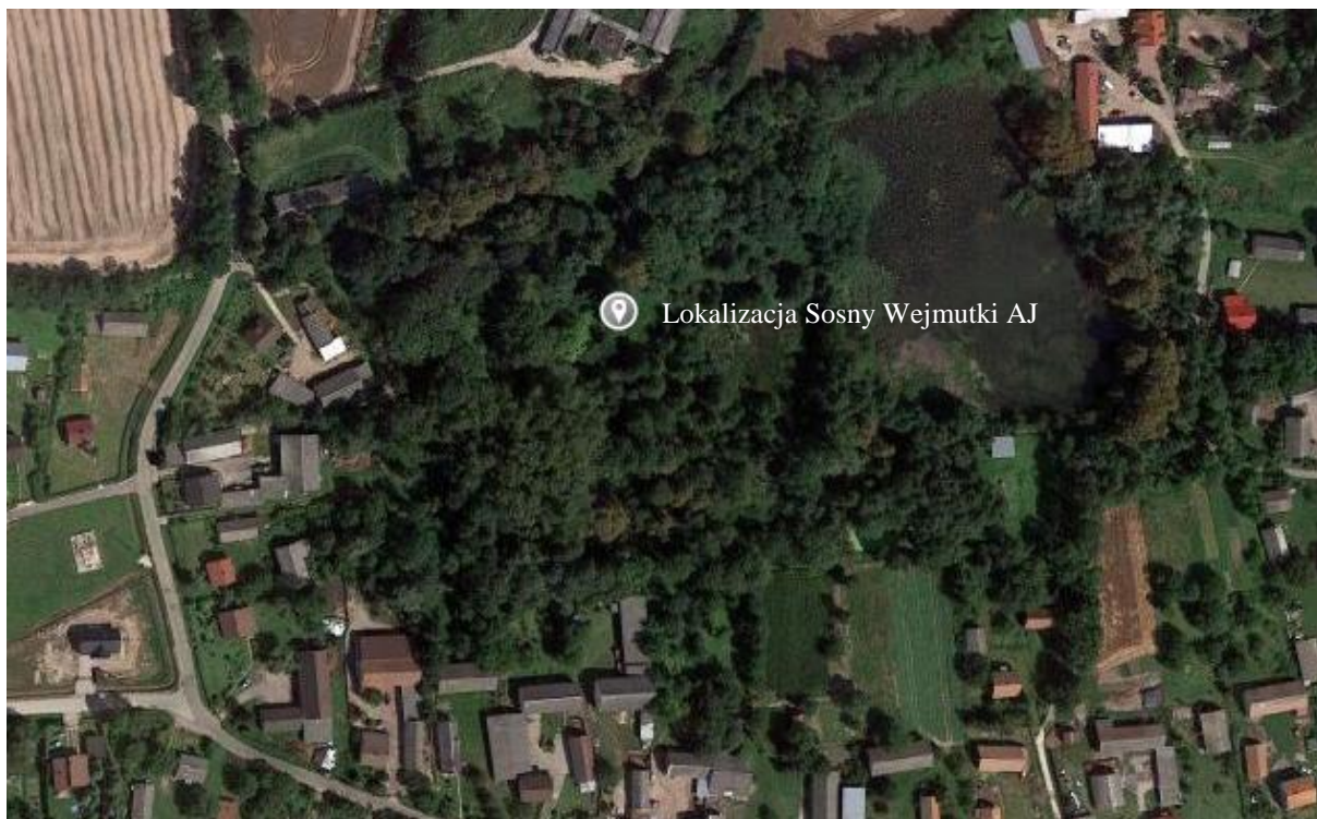
I. Mapa z lokalizacją drzewa SOSNA WEJMUTKA (źródło Google Maps) 50.305093N 20.647856E