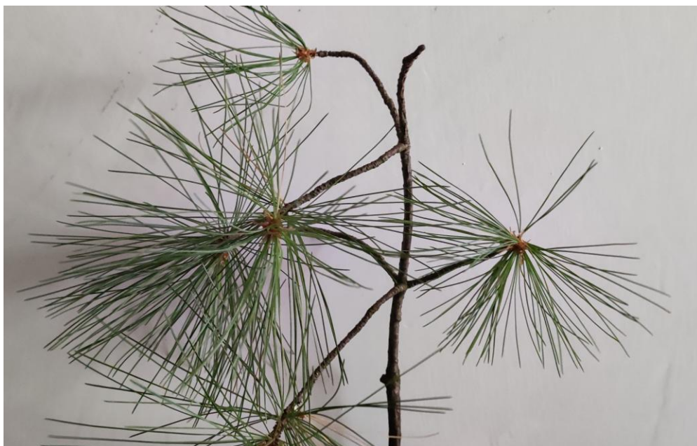
Fot: 2c: Sosna Wejmutka Igły